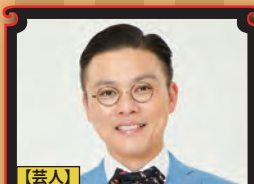
【芸人】 奥田 修二 (学天即)

『お笑い資金運用術』 『相手の心を掴むコミュニケーション術』 ファイナンシャルプランナーをはじめ数多くの資格を持つ市川の「明日から誰もが実践しやすくなる」講演。