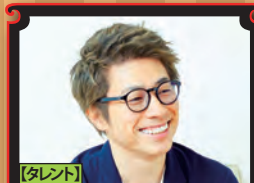
【タレント】 田村 淳 (ロンプーツ1号2号)

『今日から実践できるカンタンお料理講座』 無駄なく誰でもすぐに簡単にできる、プロ顔負けの料理テクニックを伝授。