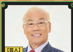
【芸人】 オール巨人 (オール阪神・巨人)

『自己研鑽と気づきや思いやりの大切さ』 『交通安全』『人生経験』『体験談』『釣り』『UFO』『毎日朝ウォーキング』 40年を超える芸歴と人生経験を踏まえて語る、オール巨人の人間力アップ講座。