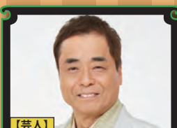
【芸人】 桂 小文枝

『桂小枝の生き方〜楽しく生きる方法論〜』 『イヤな事はしない』『毎日、規則正しく不健康な生活』『人とのコミュニケーションのとり方』など楽しく生きる方法論をわかりやすく講演。