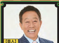
【芸人】 オール阪神 (オール阪神・巨人)

『自己研鑽と気づきや思いやりの大切さ』 『交通安全』『人生経験』『体験談』『釣り』『UFO』『毎日朝ウォーキング』 40年を超える芸歴と人生経験を踏まえて語る、オール巨人の人間力アップ講座。