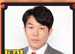
【芸人】 ヒデ (ペナルティ)

『日本の社会的養護の現状と課題』 元参議院議員として、教育・政治・社会問題を切れ味鋭く熱く語る講演会。