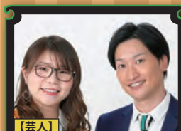
【芸人】 相席スタート

『経済の元気を掘り起こす』 あなたの会社は、もっとこうすれば明るくなる、もっとこうすれば良くなる。自信とやる気を引き出すコツをアドバイス。