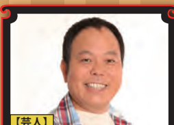
【芸人】 ほんこん (130R)

『プレゼン力』 家電、バーベキュー、サッカーなど趣味が豊富で、仕切りやトークのスペシャリストによる「伝える」プレゼンテーション講座。