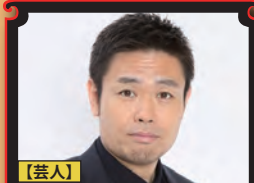
【芸人】 品川 祐 (品川庄司)

『税理士芸人が教える節税術』 元国税局で税務調査を担当、「読めば必ず得する税金の話」の著書もあるファイナンシャルプランナー芸人が語る節税術。