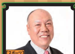
【スポーツ】 カズ 山本 (元プロ野球選手)

『ただのおたくが、なぜ年取800万円になれたのか!?!』 『アニメ関連の仕事で活躍を続ける天津向。自分の「好き」を「仕事」へと変えた発想の転換の仕方を講演。』