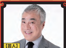
【芸人】 西川のりお (西川のりお・上方よしお)

芸能生活55年、お笑い芸人と政治家の体験談をもとに座右の銘である『人生は小さなことからコツコツ!!』と題した笑いたっぷりの講演。