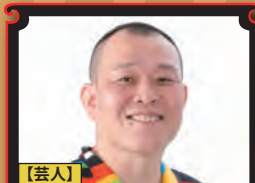
【芸人】 千原せいじ (千原兄弟)

『田村淳トークショー』 慶応義塾大学大学院メディアデザイン研究科で学び、株式会社LONDONBOOTSを立ち上げたロンプー淳。働く事・学び・死生観・事業展開等を独自の視点から語る(テーマ・内容はご希望に応じ対応)。