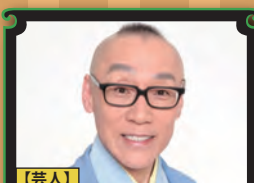
【芸人】 桂 小枝

『これをやったら若さが保たれ!! さゆり美容法紹介!!』 『若さを保つ美容法・スタイル維持の秘儀を伝授。』 『人生いろいろ〜七転び八転び〜』 事業失敗・影らむ借金・病気... 困難に笑顔で立ち向かうポジティブな生き方講座。