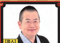
【芸人】 桂 文珍

『令和で投資を変えよう!!』 『ひねくれ者の投資術』 政治から芸能まで、タイムリーな時事ネタを落語的な視点でわかりやすく楽しく解説。