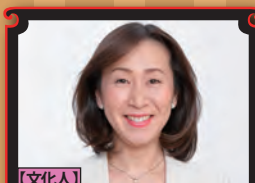
【文化人】 林 久美子 (元参議院議員)

『芸人とサラリーマン 二刀流の生き方』 芸人とサラリーマン、二足のワラジを履いているからこそ見える、「社会の新たな可能性」や「社会問題」に切り込みます!