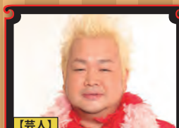
【芸人】 ハチミツ二郎 (東京ダイナマイト)

『100万人のフォローを生む SNS 発信法講習会』 『100万人のフォローを生む SNS 発信法講習会』 『100万人のフォローを生む SNS 発信法講習会』 『100万人のフォローを生む SNS 発信法講習会』 『100万人のフォローを生む SNS 発信法講習会』