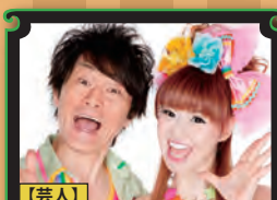
【芸人】 かつみ さゆり

生まれつき難聴ながらプロになった経験や「諦めない気持ち」 『目標の作り方』をアドバイス。