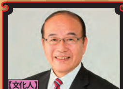
【文化人】 中野 寛成 (元国家公安委員会委員長)

『世界から見た日本』 世界中を訪れてきた体験をもとに語る日本人の良い点悪い点。そして、あらゆる人々とのコミュニケーション法のヒント。