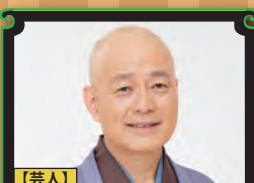
【芸人】 桂 枝女太

『笑い笑われ50年。〜長く強く〜』 『笑い笑われ50年。〜長く強く〜』 『笑い笑われ50年。〜長く強く〜』 『笑い笑われ50年。〜長く強く〜』