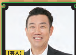
【芸人】 あいはら 雅一 (メッセンジャー)

『相席スタートの男と女のコミュニケーション術』 ワンランク上の上手な男女のコミュニケーション術。『人生が楽しくなる幸せの法則』仕事や学業のモチベーションUP維持のコツ。