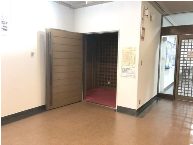
• 車いすのお客様用の入口

開場のお客様の混雑状況によっては少しお待ちいただくこともございますが、ご了承ください。