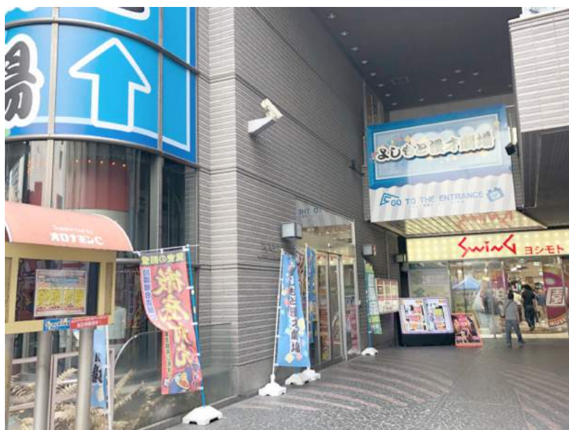
• YES NAMBA ビル入口

YES NAMBA ビル1F ドン・キホーテのエレベーターより5F へお上がりください。