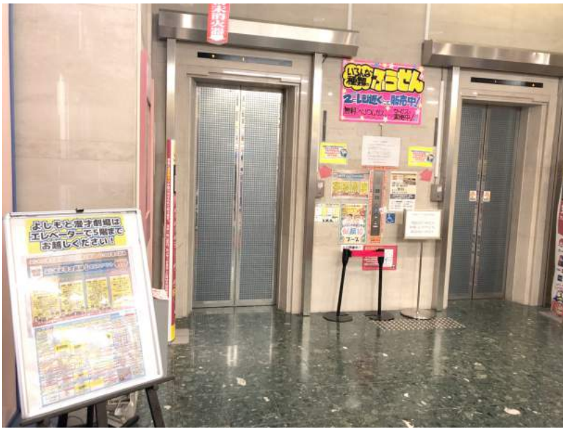
・1F ドン・キホーテ エレベーター前