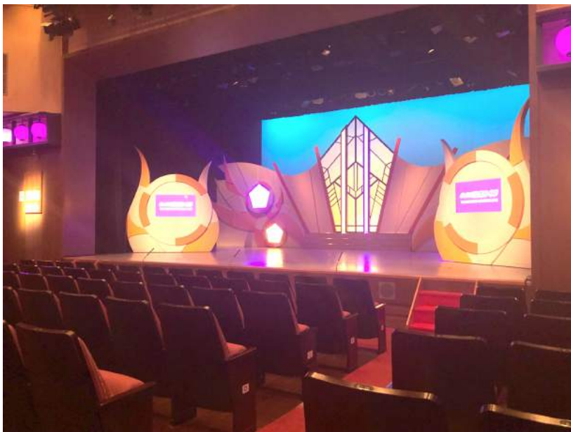
• 車いす専用スペースからの舞台の様子