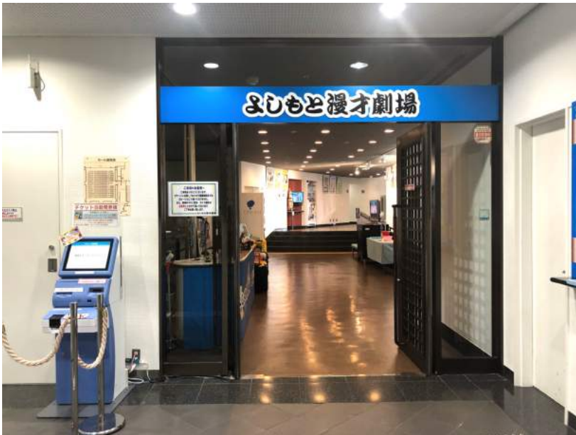
・5F よしもと漫才劇場 劇場入口